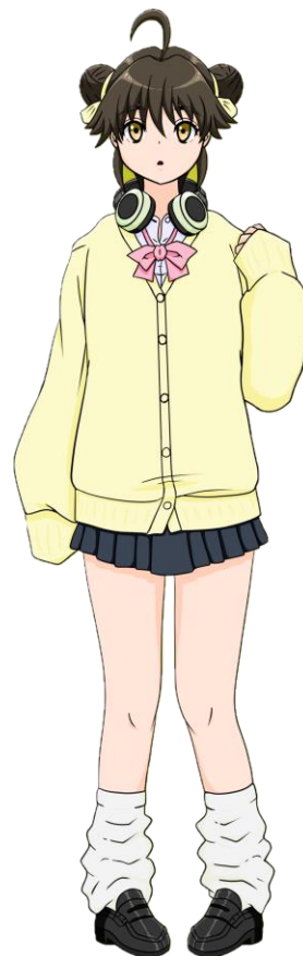
龍場 黄虎 (がんばここ) 立ち絵