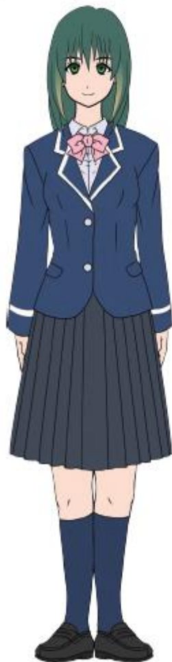
佐原 師代 (さほらかずよ) 立ち絵