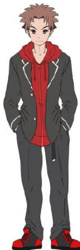
似鳥一輝 (にとりいつき) 立ち絵